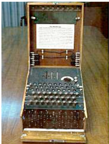
二战时德军的恩尼格玛机

图灵及团队根据波兰提供的信息，成功地破解了德军“恩尼格玛机”（Enigma machine）以及其它密码系统发出的密码。毫无疑问，图灵等人的成功改变了这场战争的结果，也改变了历史。