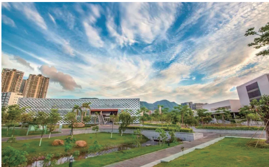
南科大校园风光。