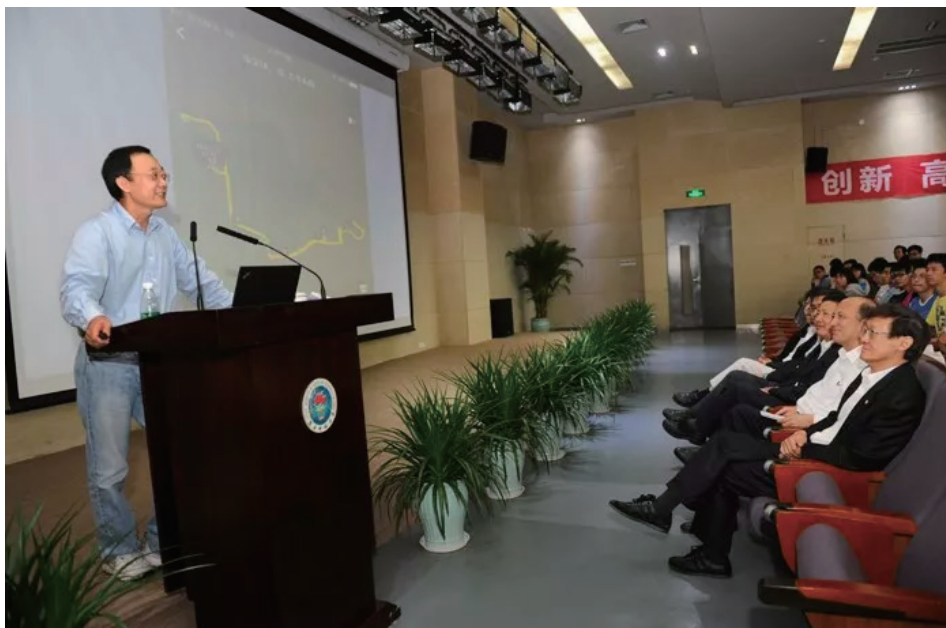
2015年3月18日，夏志宏在南科大作报告。

2015年2月春节过后，陈十一赴深圳担任南科大第二任校长。十一和我都是北大首批长江学者，上次见到他还是好几年前在北京的一次聚会上。当时韩启德老师夫妇请饶毅、施一公、陈十一和我四家人在全国人大小聚，记得十一意气风发，大谈他所创的北大工学院令人鼓舞的发展，同时他和众人一起劝我也全职回国。我发微信对十一当选南科大校长表示祝贺，他当即邀请我访问南科大，我欣然答应，约好3月18号在南科大见。但却没想到十一的邀请别有用心。