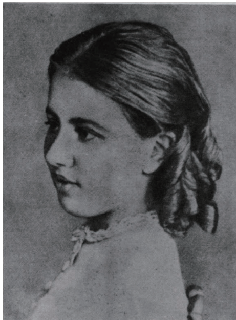
图 2. 青少年时代的索菲娅

语和初等数学。教她初等代数和几何的老师是波兰人马列维奇 (Yosif I. Malevich)，他惊奇地发现这女孩对数学特别着迷。原来她对数学的兴趣是早年由她伯父彼得·克鲁科夫斯基 (Pyotr V. Krukovsky) 启发的。伯父爱好数学，给这位小侄女讲了许多有趣的数学故事，诸如化圆为方、可以不断趋近但又永远不能达到的渐近线，等等，让她对数学充满了好奇和幻想。